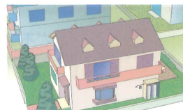
個別供給のお客様

※質量販売、国および地方公共団体、工業・農業用など高压ガス保安法上の消費者は対象外となります。