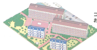
コミュニティーガス団地の お客様